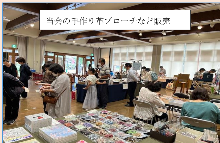
当会の手作り革ブローチなど販売