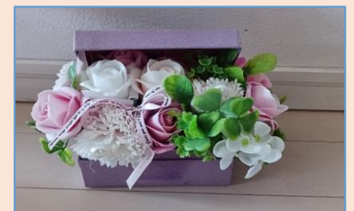
皆さんお花が大好きです

1時間ほどで完成し、お茶の時間は傾聴タイムです。とても賑やかで、こんな話の弾んだ傾聴はなかなかありません。ご自分の作成したブーケを大切に抱え、皆さん笑顔でお帰りになりました。(参加者 24名)