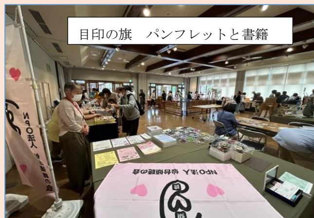
目印の旗 パンフレットと書籍