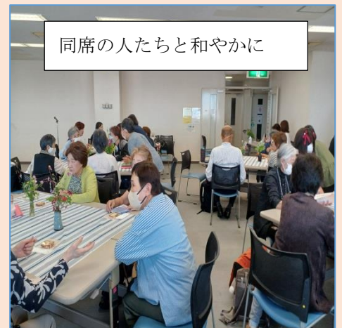
同席の人たちと和やかに