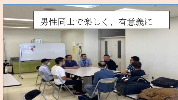
男性同士で楽しく、有意義に