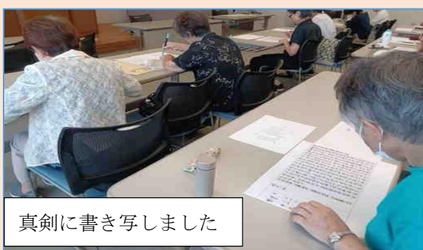
真剣に書き写しました

参加者の皆さん、慣れないながらも真剣に取り組んでいました。書き終わり、残りの1時間はお茶を飲みながらの会話で、奥の深い写経の感想を話し合いました。(参加者22名)