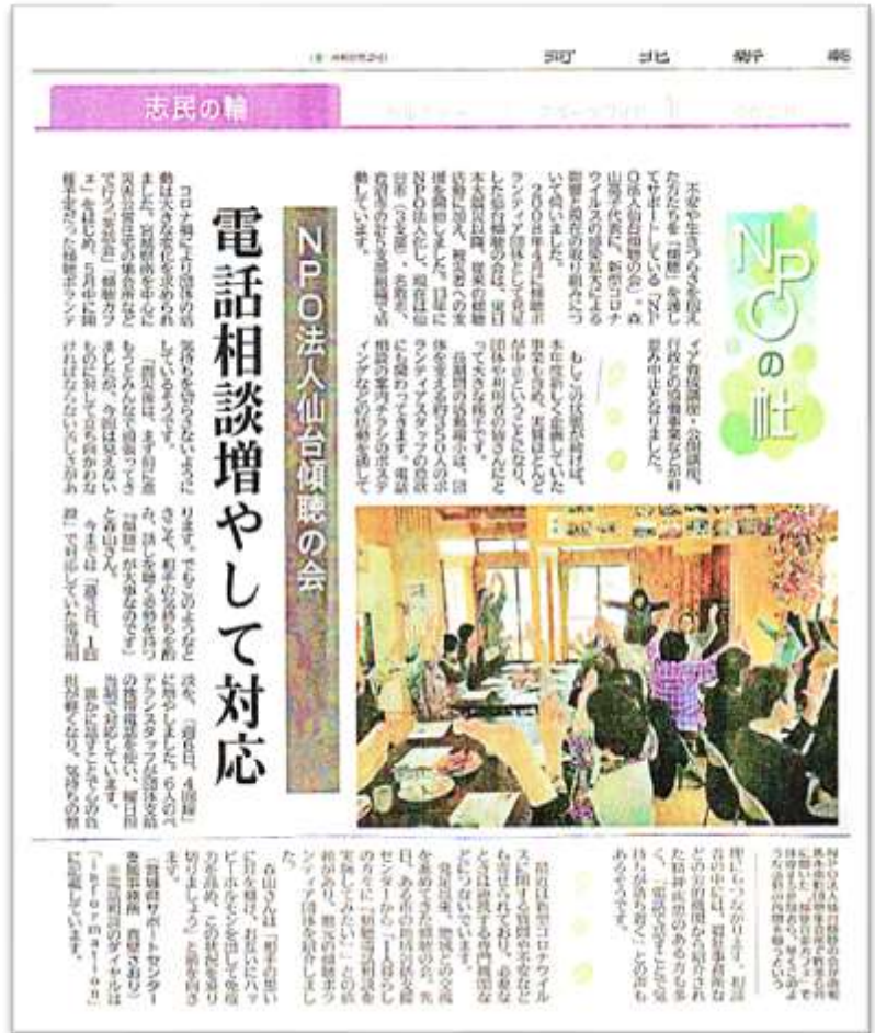
↑紙面内の写真は昨年6月開催の南相馬市南町団地集会所での「傾聴音楽カフェ」。早くこのような活動の再開を願う。