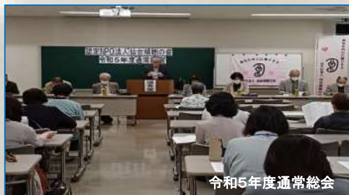
令和5年度通常総会