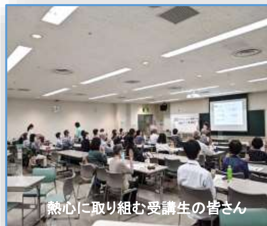
熱心に取り組む受講生の皆さん